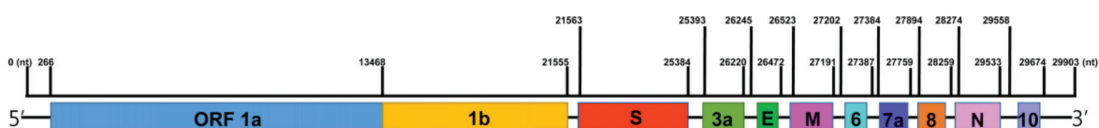
Figura 2 - Representação dos genes utilizados para detetar a presença de SARS-CoV-2 em RT-PCR.

A primeira abordagem de diagnóstico, e por se tratar de um vírus desconhecido até então, teve como base o genoma que foi sequenciado e publicado após o início do surto em Wuhan (GenBank: MN908947.3). Foi usado para desenhar primers e sondas específicas para determinados genes, como ORF 1a, ORF 1b, RdRp (gene da RNA polimerase), E e N, representados na Figura 2 e utilizados em técnicas de biologia molecular como RT PCR (Ahn et al., 2020; Tripathi et al., 2020).